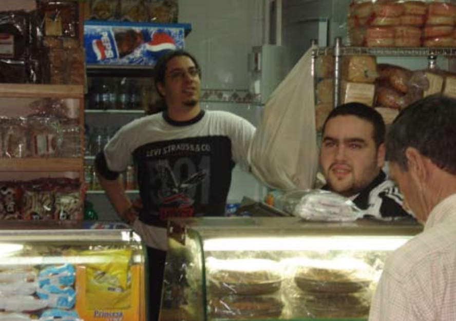
Una sonrisa por bandera