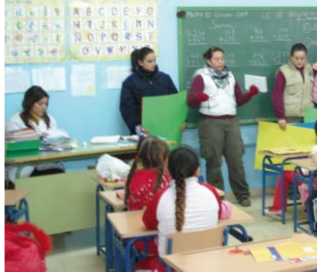
Huerto en el CEIP. Ntra. Sra. de la Paz