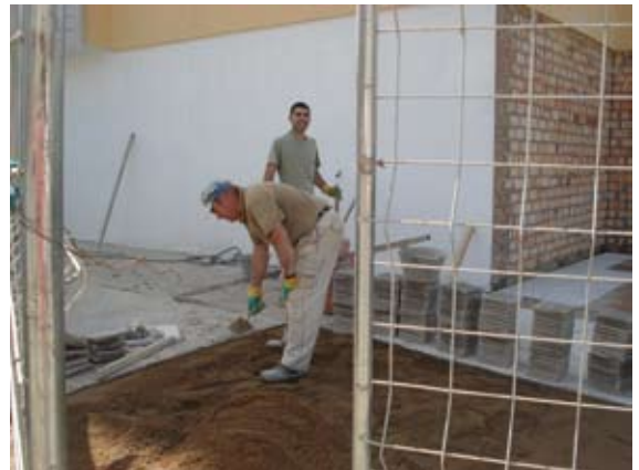
Poco a poco cambiando la imagen del Barrio