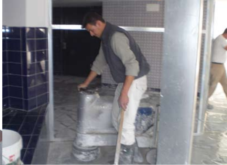
Sacándole brillo al suelo