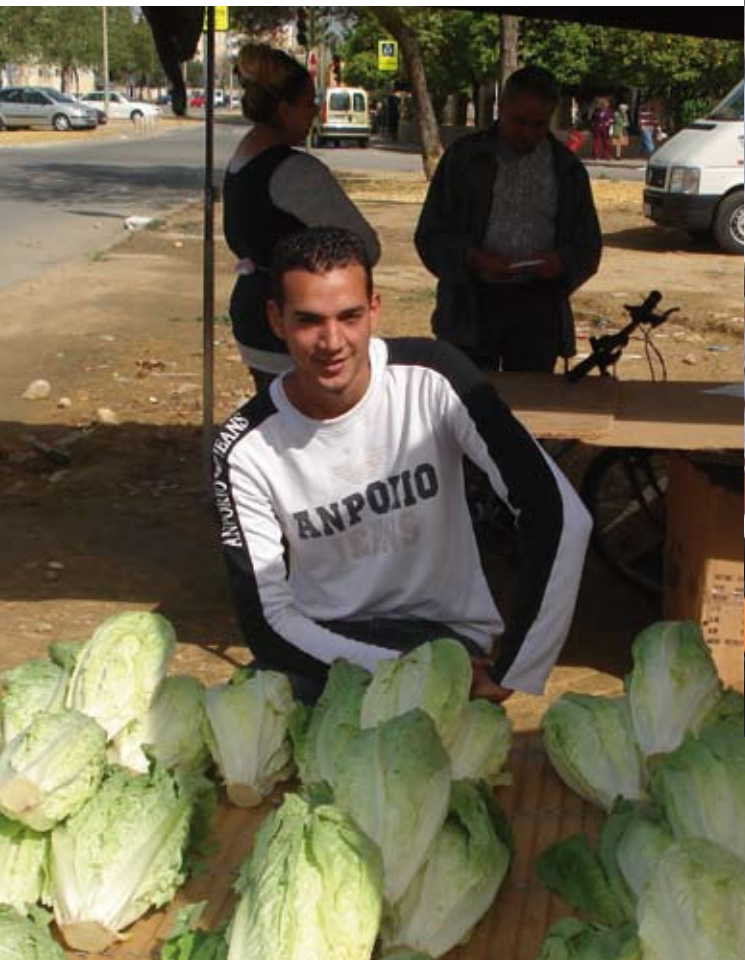
Ganándose la vida