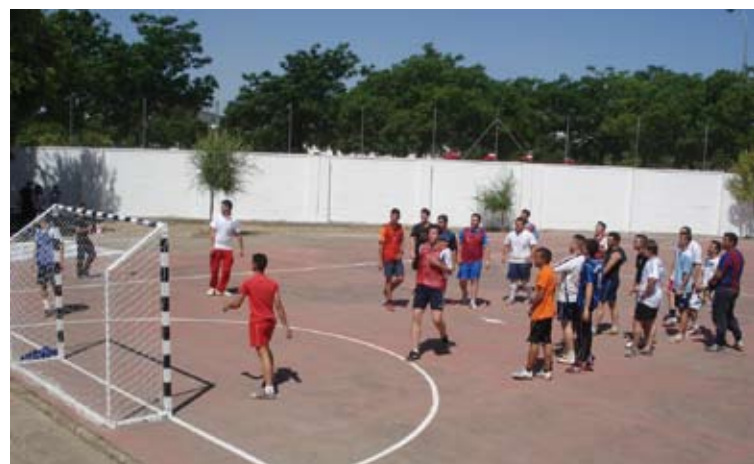
Campeones. Partido de fútbol con la ET San Fernando