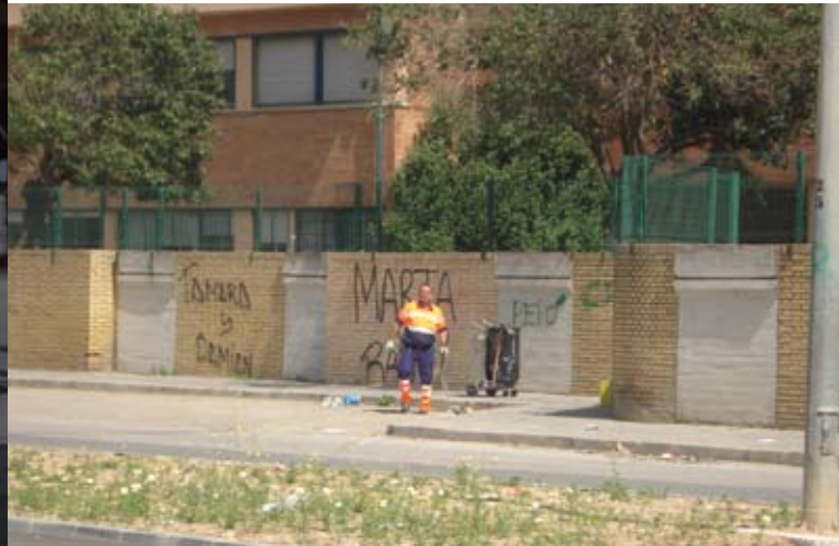
No todo es suciedad