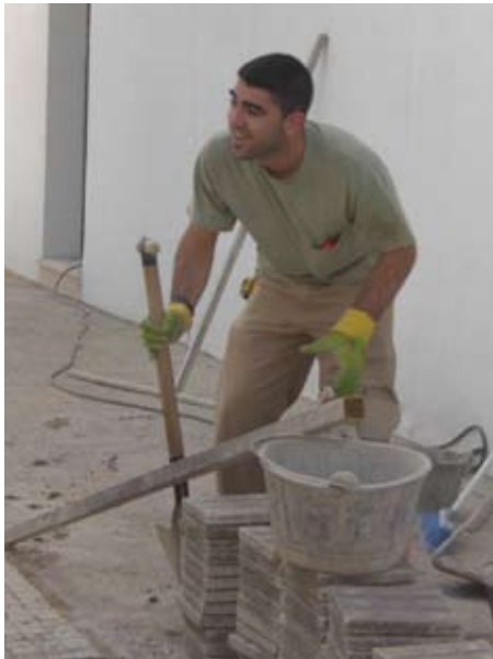
Joven ganándose la vida