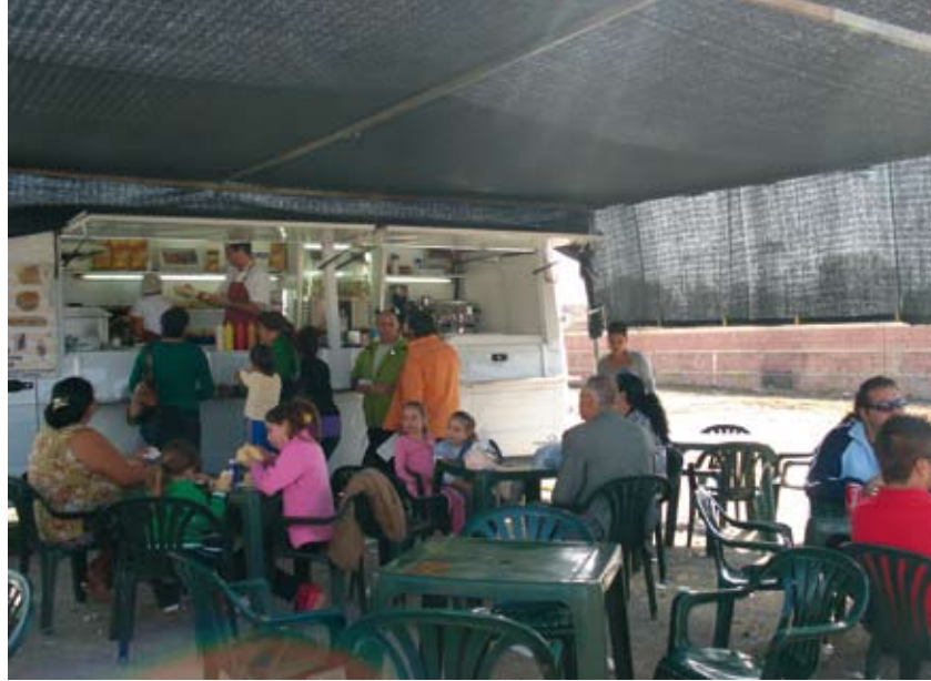
Un descansillo no viene mal