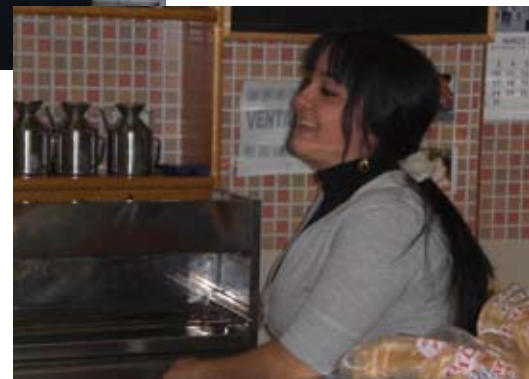
Trabajando con una sonrisa

En el barrio, el pequeño comercio tiene su mercado. El/la comerciante nos atiende con una buena sonrisa y profesionalidad.