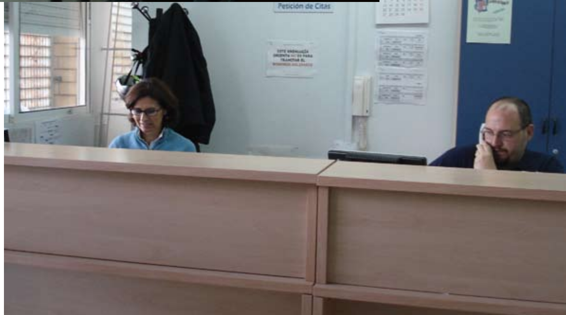
Centro de Orientación y Dinamización para el Empleo. CODE

El barrio tiene buenos profesionales que informan, ayudan a buscar empleo y nos enseñan a movernos en el entorno laboral.