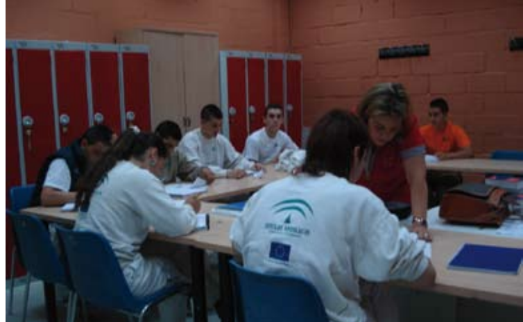
Formación básica con el CEPER. Polígono Sur