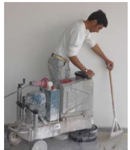
En Polígono Sur se trabaja

Se están realizando varias obras en el barrio para mejorarlo, estamos muy ilusionad@s por ver el aspecto que van a tener una vez terminadas, tenemos esperanza en que todo mejore y se mantengan en buen estado.