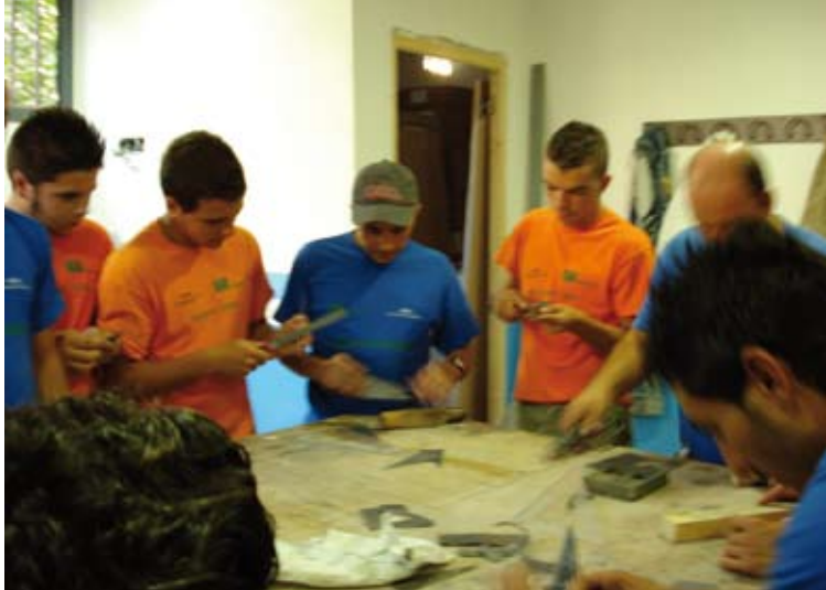
Intercambio con el Taller de Empleo Polígono Sur