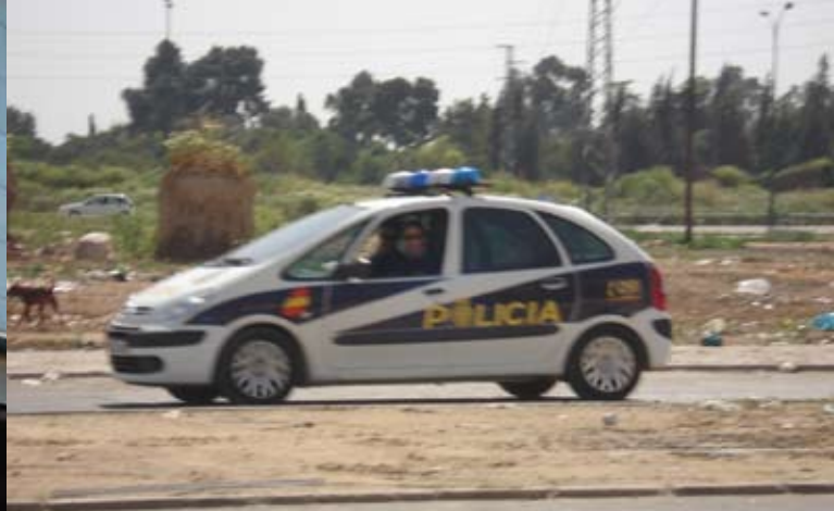
Seguridad y vigilancia