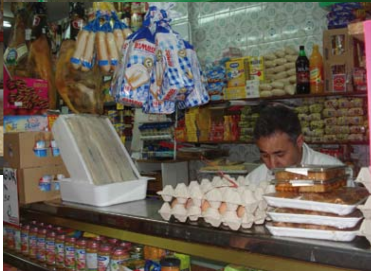
El valor de la experiencia