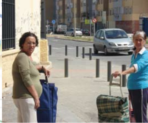
Mujeres con la compra