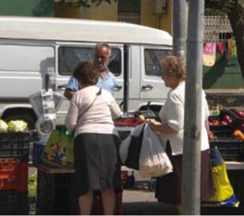
A falta de pan buenas son migas