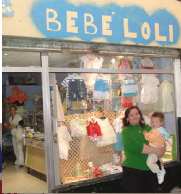
De todo un poco