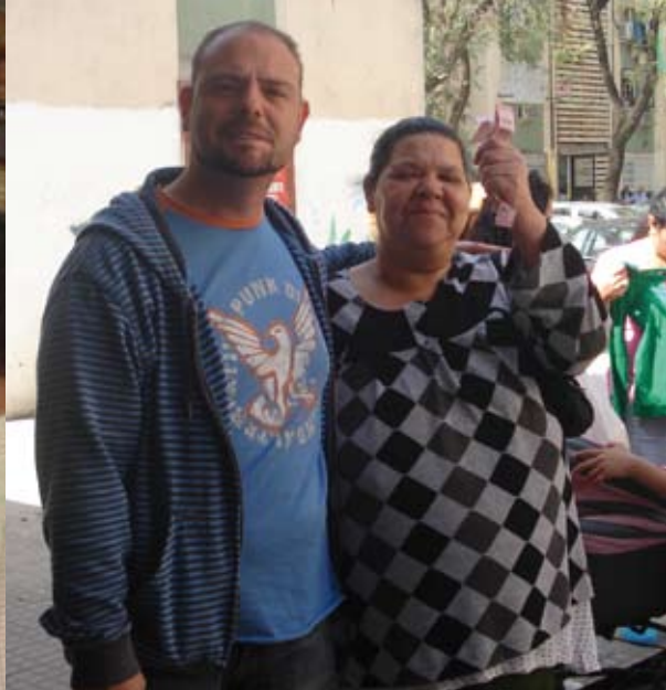
Venta de papeletas

“Aprendí que no se puede dar marcha atrás, que la esencia de la vida es ir hacia adelante. La vida, en realidad, es una calle de sentido único.”