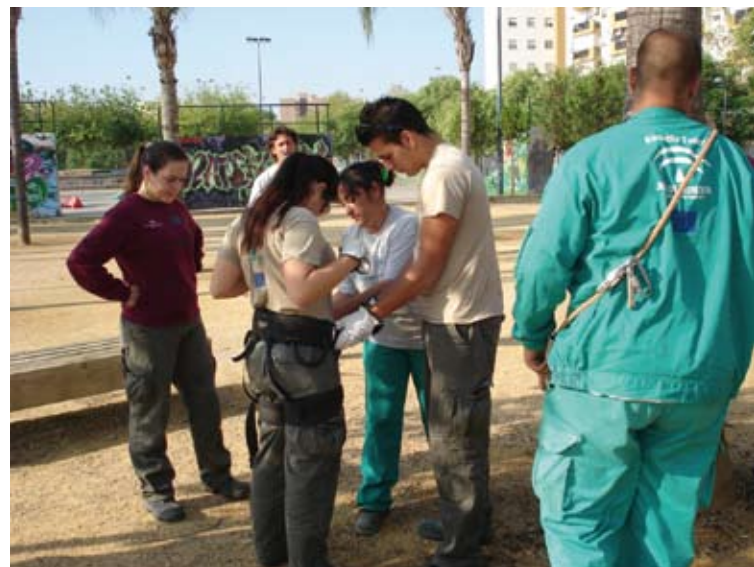
ET Miraflores. Poda en altura

“Fórmate tú en vez de esperar a que te formen y modelen.”