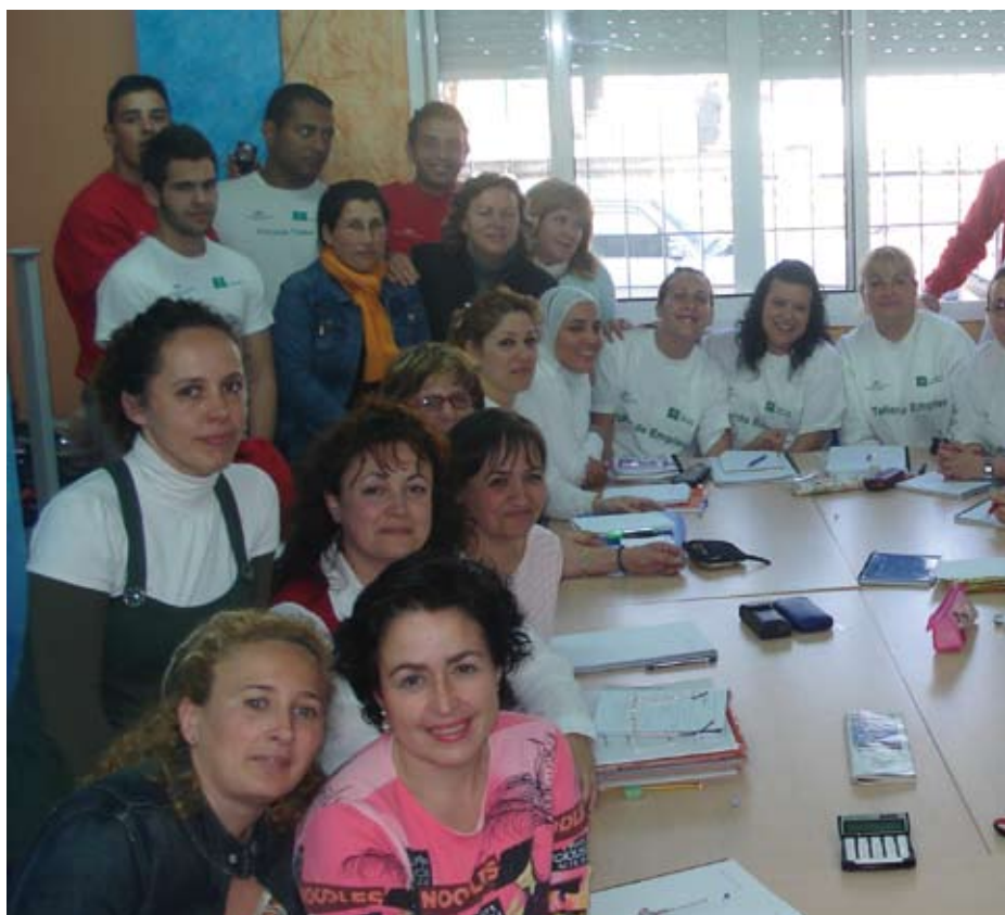
Taller de Empleo Comunidad y Territorio

Intercambiar experiencias, compartir lo que sabemos, o pasárnoslo bien junt@s. Hemos visto que mujeres del barrio no sólo trabajan en sus casas limpiando, ellas realizan cursos formativos como los talleres de empleo, y acuden a reuniones como la Coordinadora de Asociaciones de Mujeres. Se forman día a día. Trabajar con niñ@s de los colegios, aprender de otr@s compañer@s, etc. ha sido muy enriquecedor para nosotr@s.